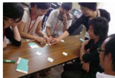
昨年度のオリエンテーションの様子

AB コース 本研修に参加した動機を振り返り、研修中の目標や、参加者同士がお互いを知り合う場です。また、Aコースの方は、インターンシップ先団体との、顔合わせを行います。 日時:8/27(土)10:00~17:00 場所:COMBi本陣