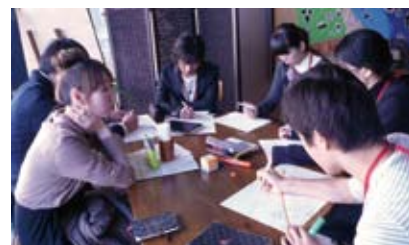
昨年度の先輩訪問の様子